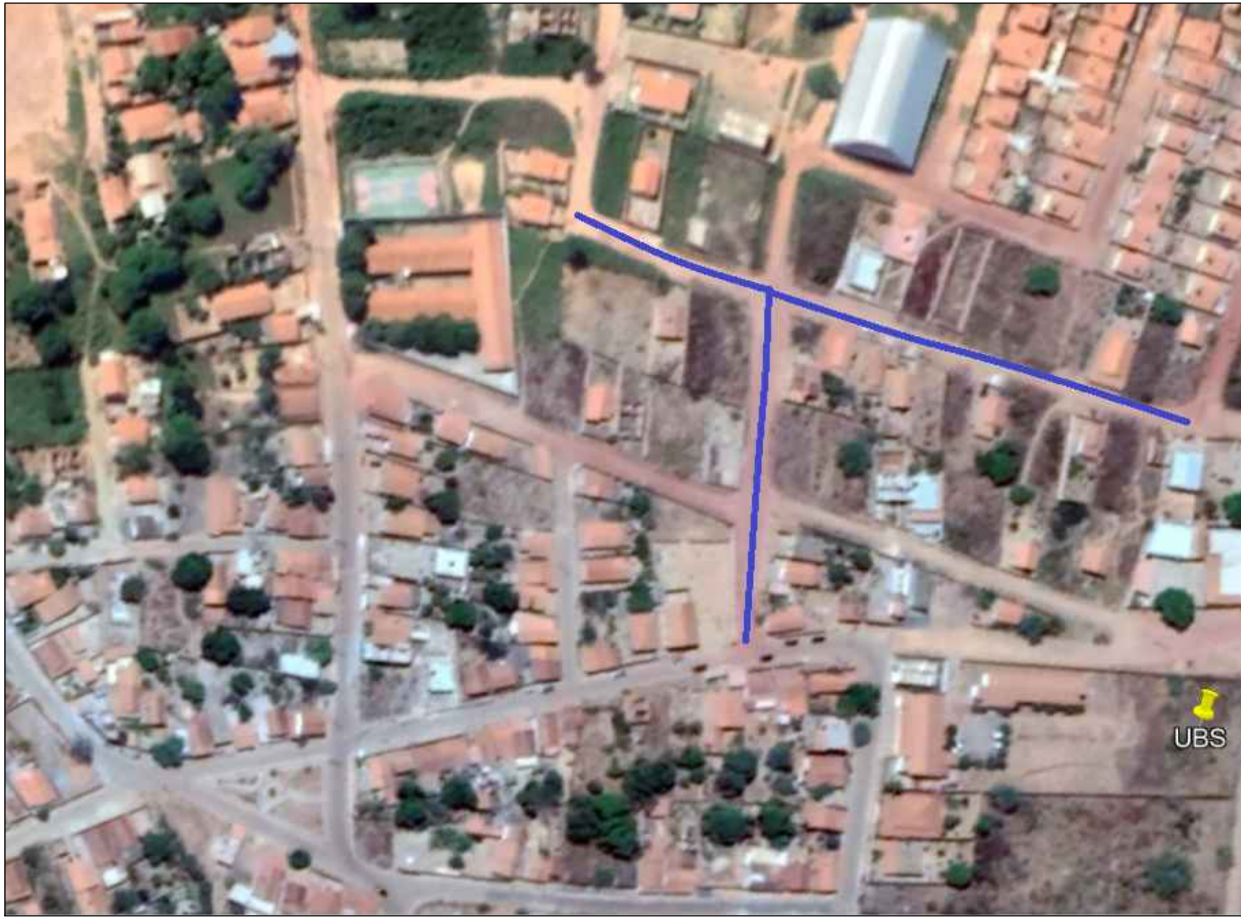
PLANTA DE LOCALIZAÇÃO DAS RUAS A SEREM CALÇADAS SEM ESCALA