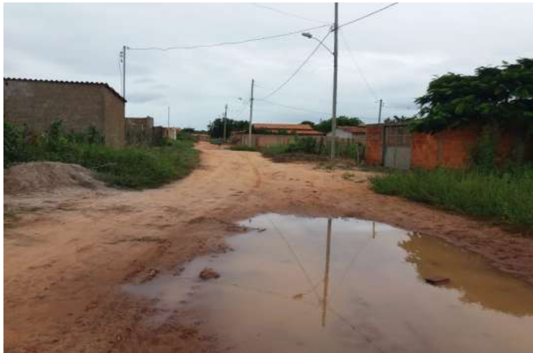
Figura 06- Rua Aristeu Jose de Souza