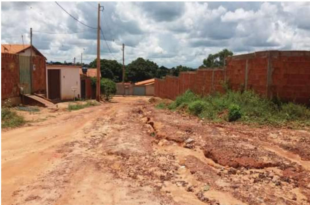
Figura 03- Fonte: Autor Próprio, Rua João Maroto Correa de Brito.