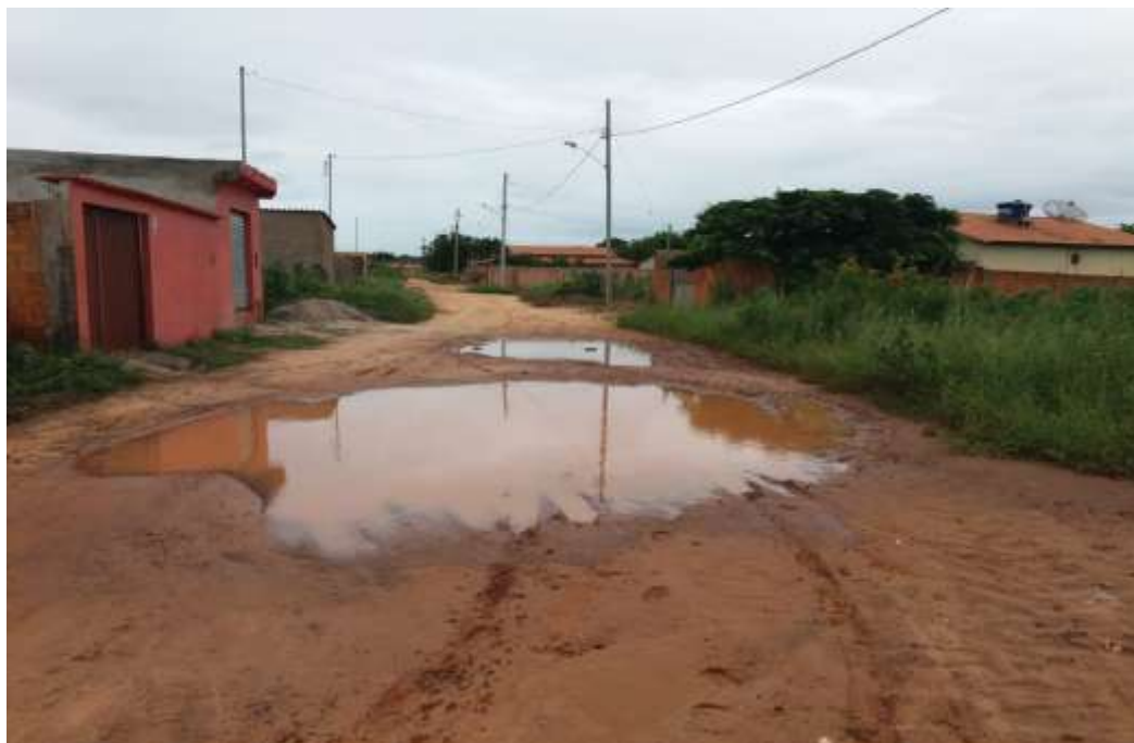
Figura 05- Rua Aristeu Jose de Souza