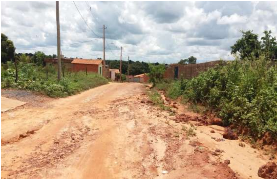
Figura 01- Fonte: Autor Próprio, Rua João Maroto Correa de Brito.