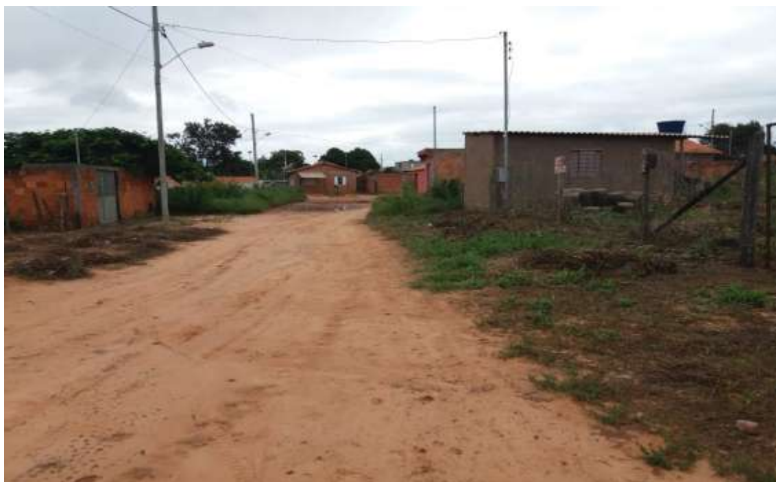
Figura 07- Fonte: Autor Próprio, Rua Aristeu Jose de Souza