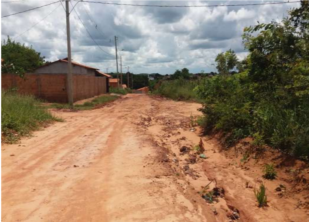
Figura 02- Fonte: Autor Próprio, Rua João Maroto Correa de Brito.