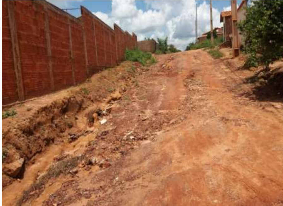
Figura 04- Fonte: Autor Próprio, Rua João Maroto Correa de Brito.