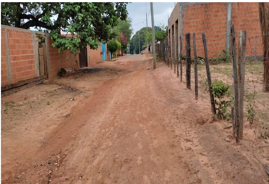
Figura 07- Fonte: Autor Próprio, Rua Sao Geraldo.

Rua do Comércio, 341- Centro - Ibiracatu/MG - CEP 39455-000