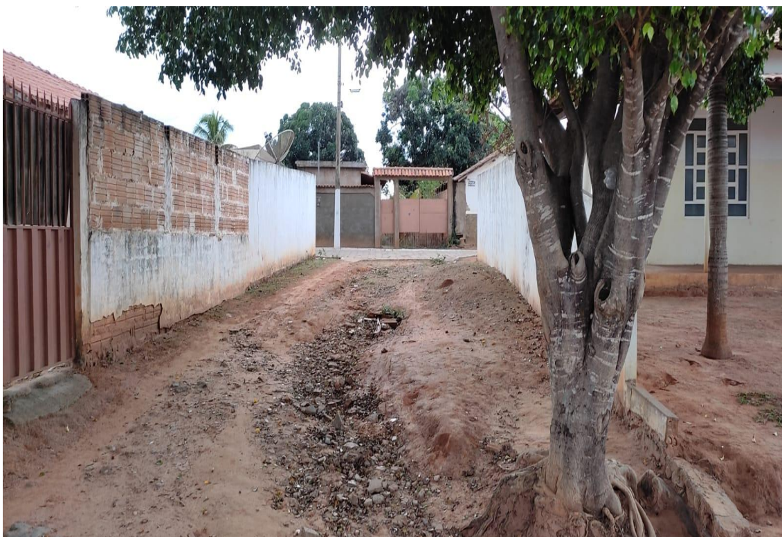
Figura 13- Rua Do Lado PSF

Rua do Comércio, 341- Centro - Ibiracatu/MG - CEP 39455-000