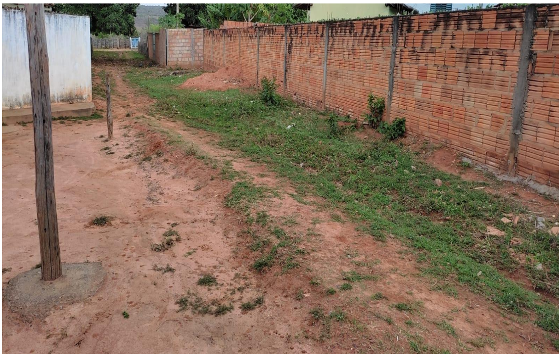
Figura 15- Rua America.

Rua do Comércio, 341- Centro - Ibiracatu/MG - CEP 39455-000