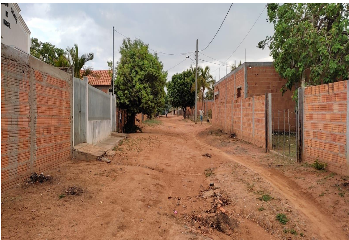
Figura 08- Fonte: Autor Próprio, Rua Sao Geraldo.