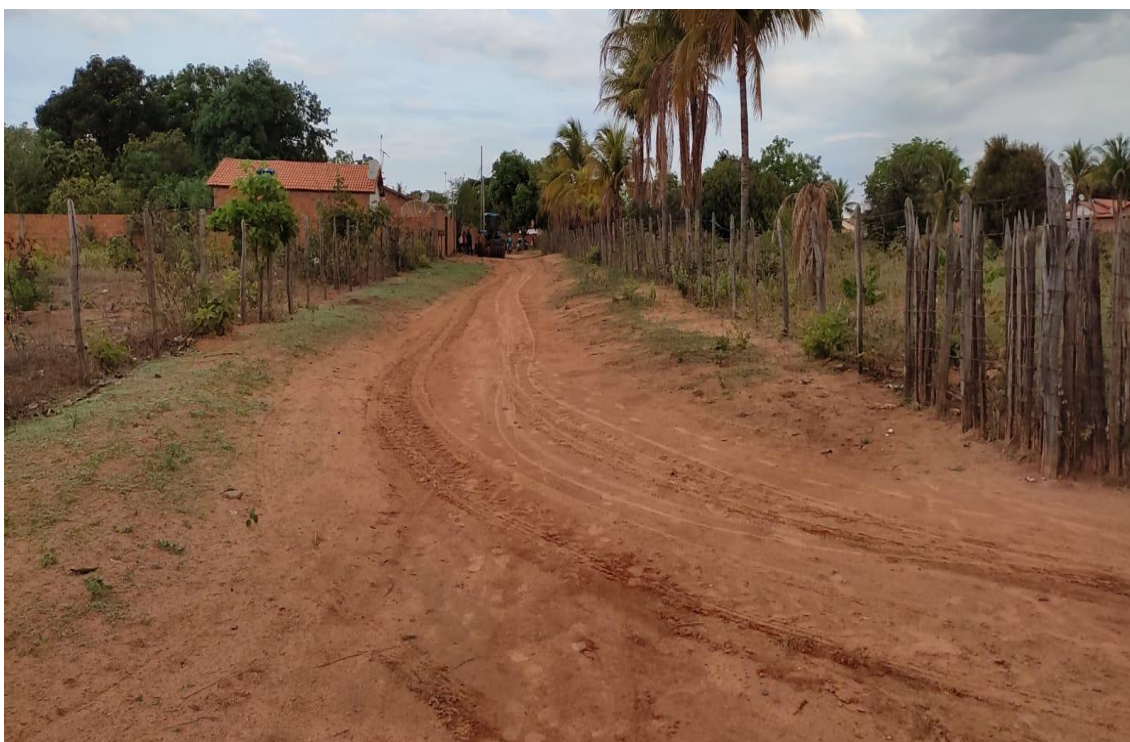
Figura 10- Fonte: Autor Próprio, Rua Jose Vicente.