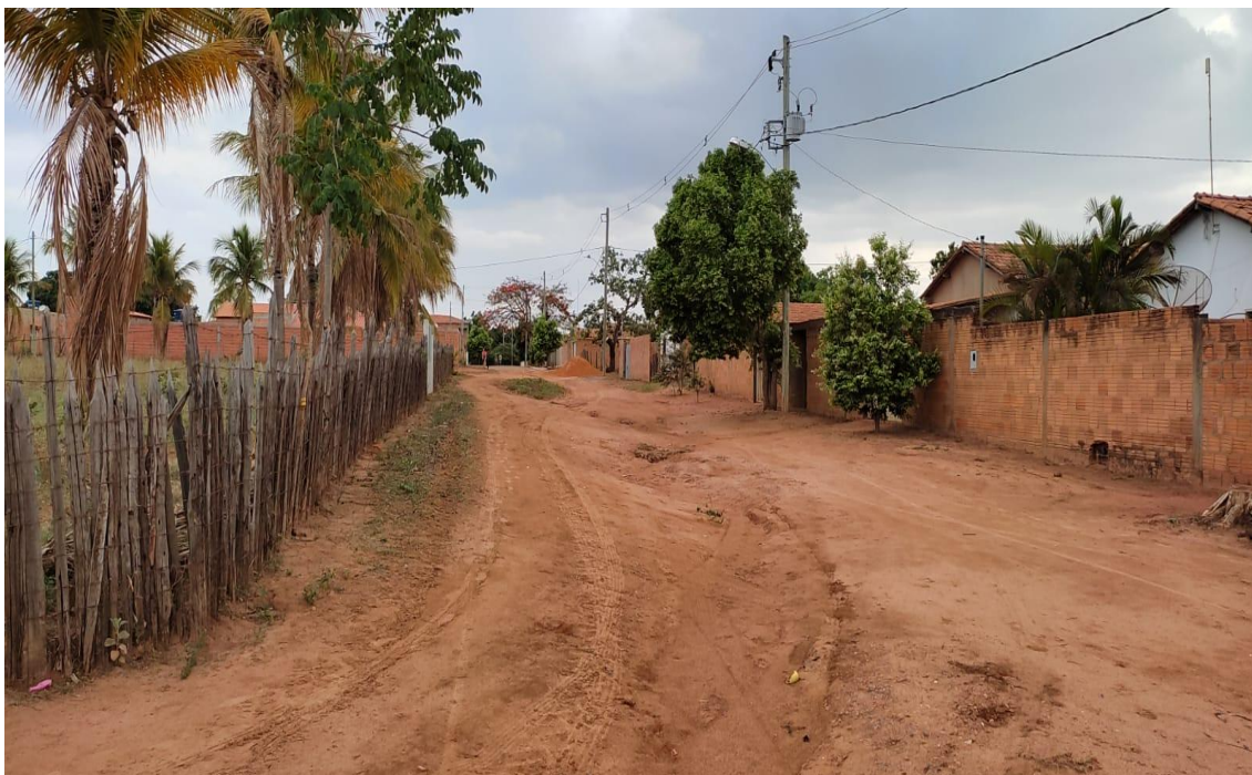
Figura 11- Rua Domingos Alves

Rua do Comércio, 341- Centro - Ibiracatu/MG - CEP 39455-000