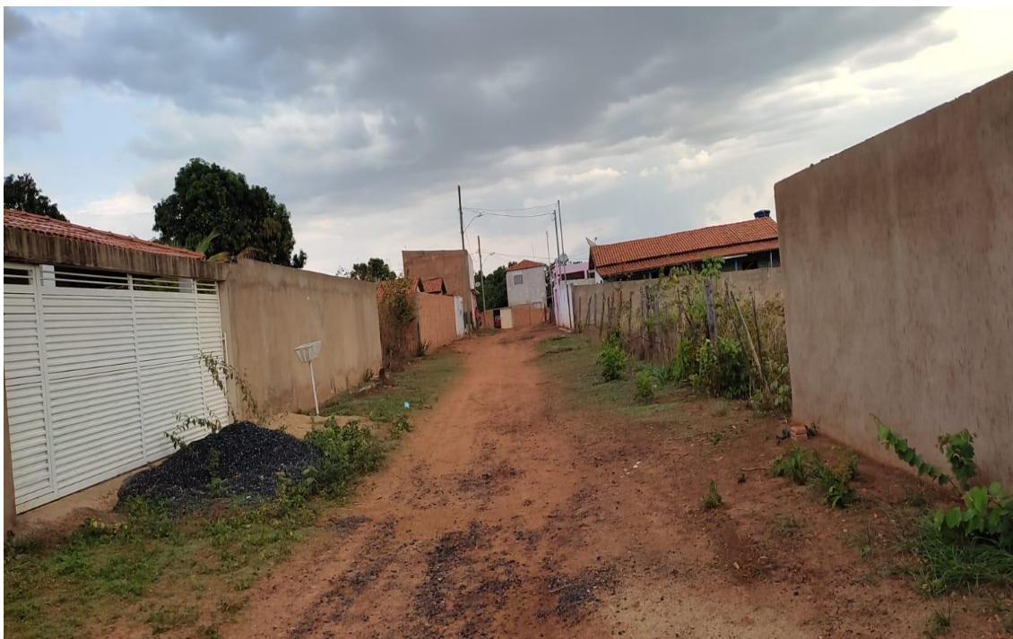
Figura 01- Fonte: Autor Próprio, Rua Altino.

Rua do Comércio, 341- Centro - Ibiracatu/MG - CEP 39455-000