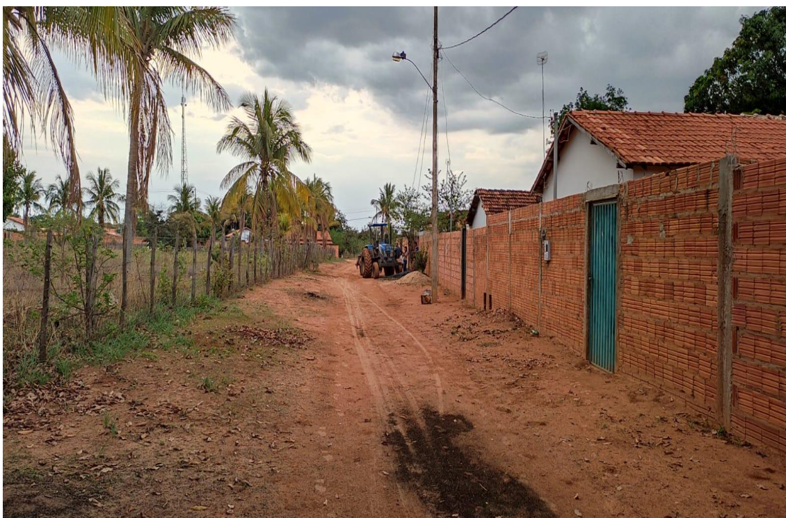
Figura 09- Rua Jose Vicente.

Rua do Comércio, 341- Centro - Ibiracatu/MG - CEP 39455-000