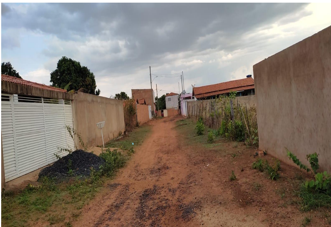
Figura 02- Fonte: Autor Próprio, Rua Altino.