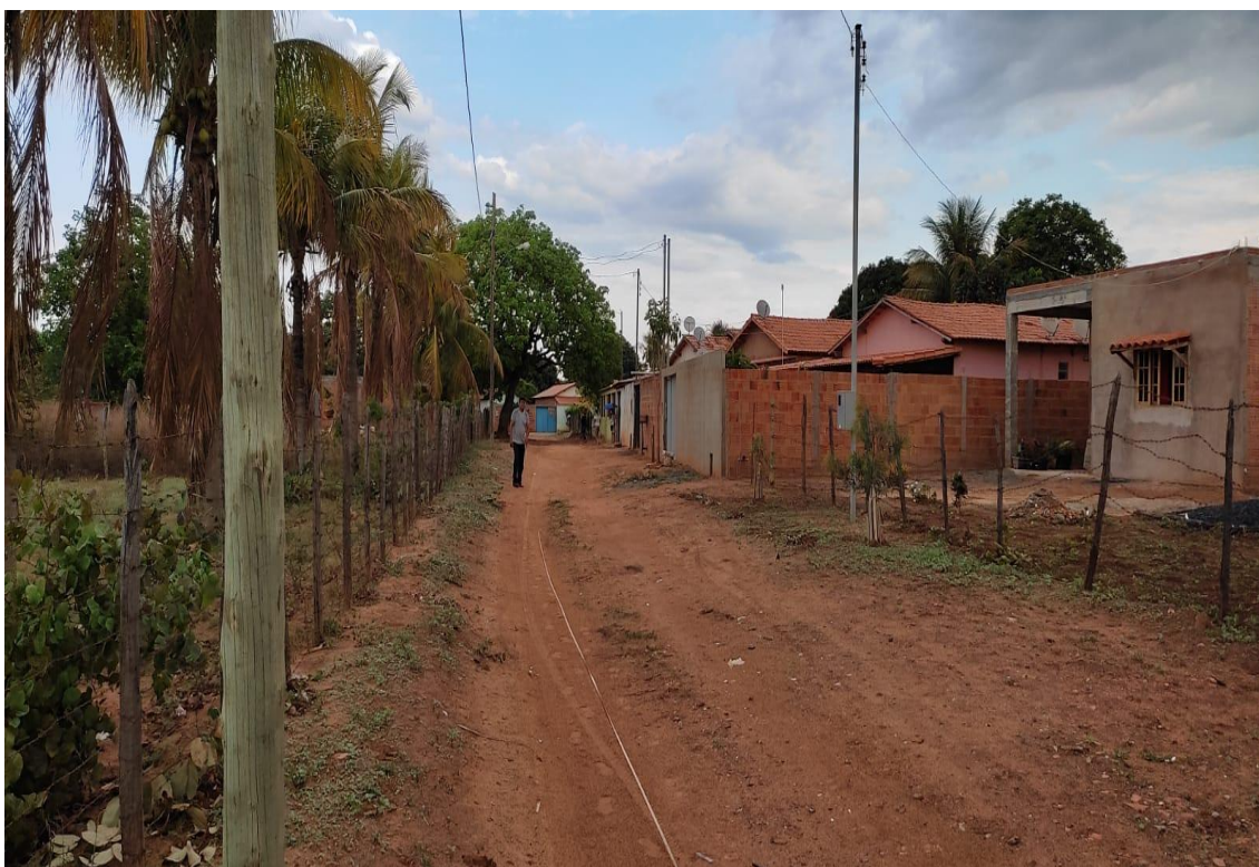
Figura 05- Rua São Jose.

Rua do Comércio, 341- Centro - Ibiracatu/MG - CEP 39455-000