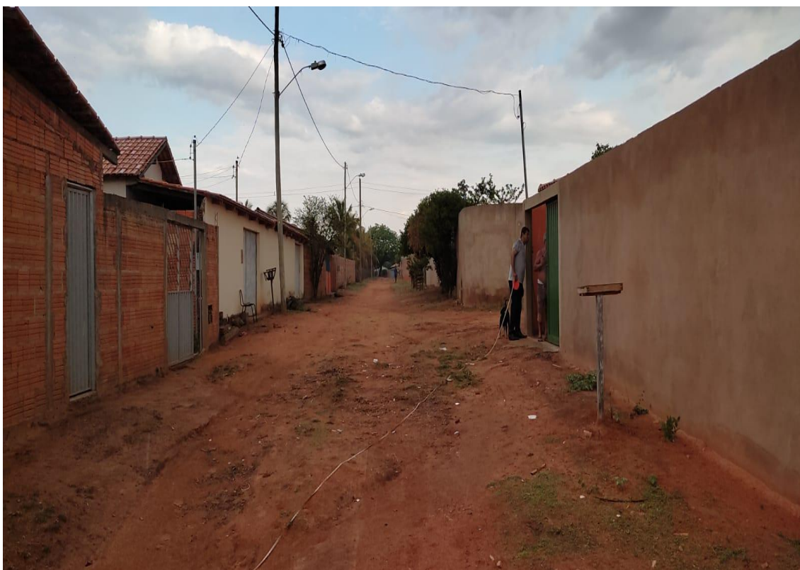
Figura 04- Rua São Jose.