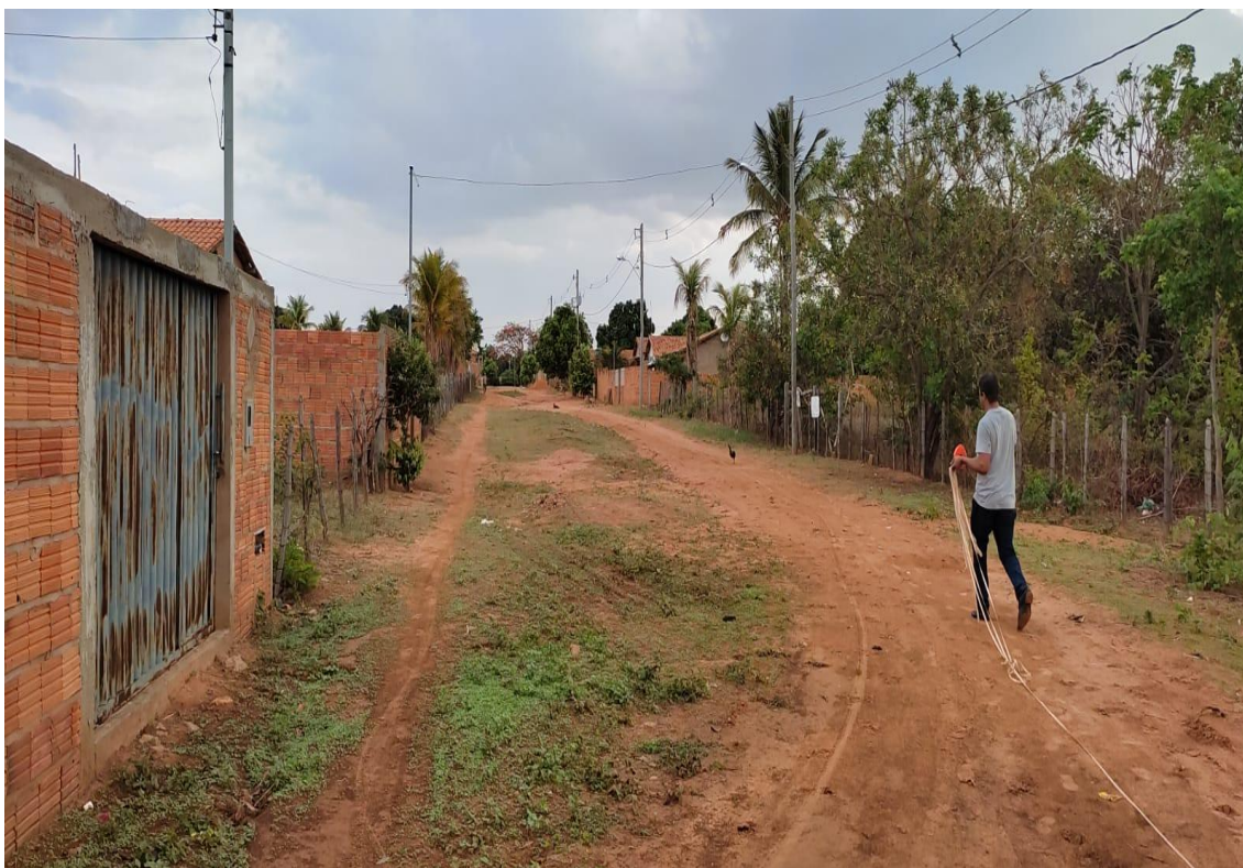
Figura 12- Fonte: Autor Próprio, Rua Domingos Alves