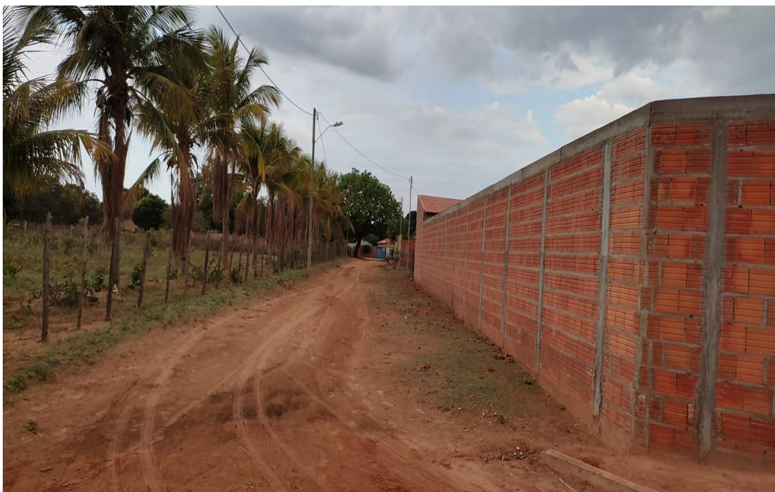
Figura 06- Rua São Jose.