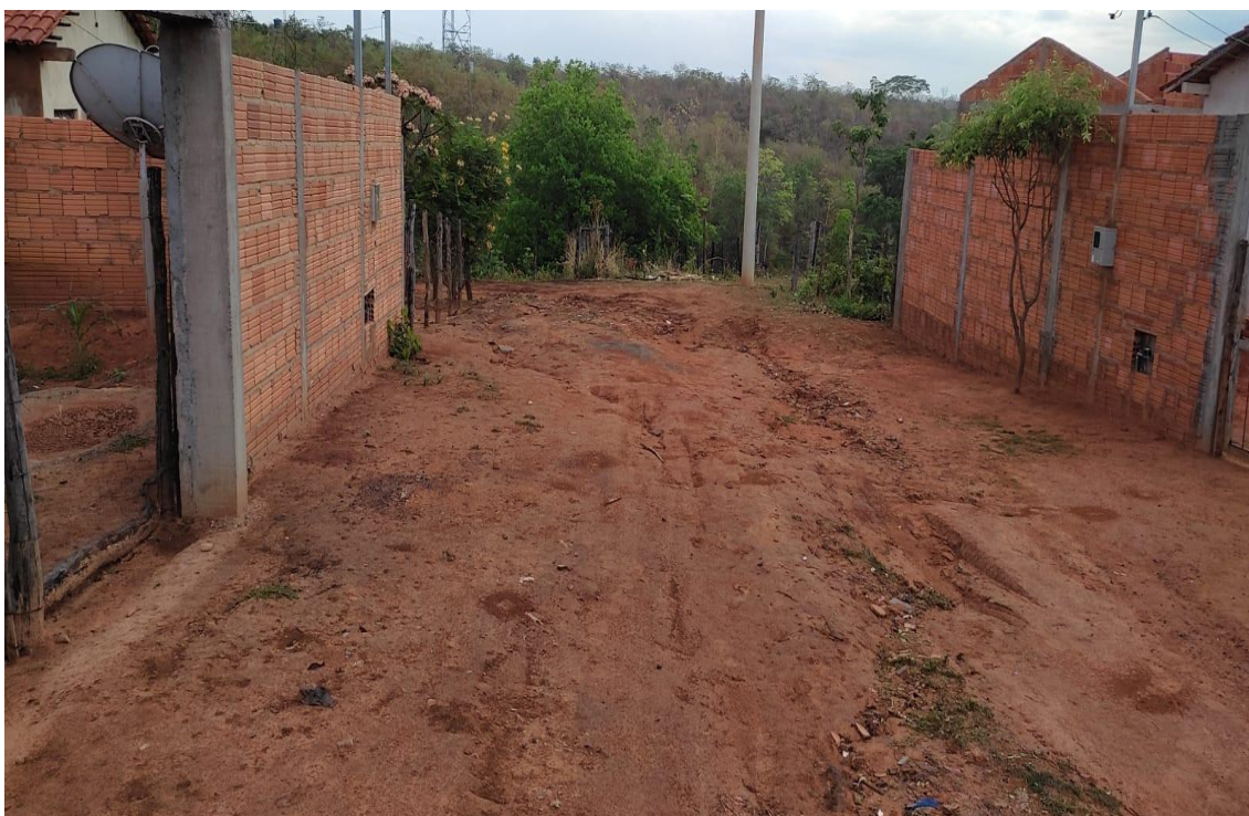
Figura 03- Rua Sao Jose.

Rua do Comércio, 341- Centro - Ibiracatu/MG - CEP 39455-000